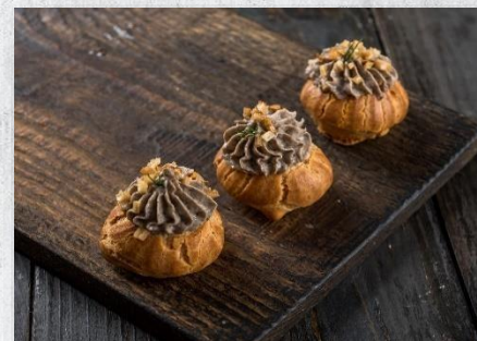
Профитроль из заварного теста с муссом из грибов