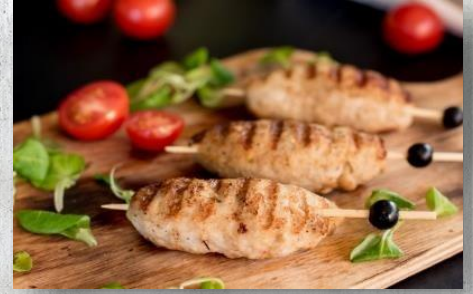
Люля-кебаб куриные 1 шт. / 60 гр. 205 руб.