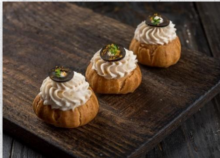
Профитроль из заварного теста с куриным муссом