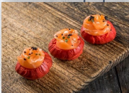
Профитроль из красного заварного теста «Red Label» с сёмгой