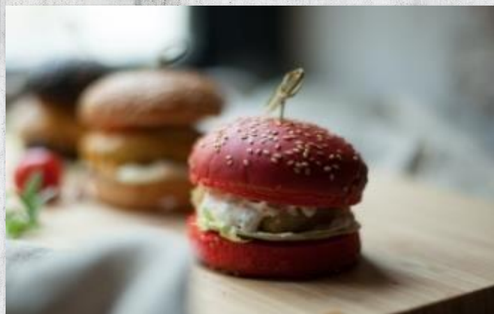
Красный «фишбургер» с соусом тар-тар и сыром чеддар (диаметр 6 см)