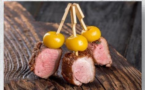
Шашлык из утки с черри 1 шт. / 50 гр. 335 руб.