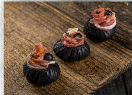
Профитроль из чёрного заварного теста «Black Star» с Хамоном и голубикой