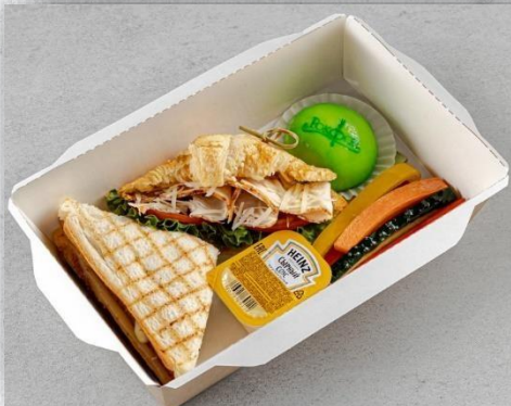
Бокс детский «Миньон»