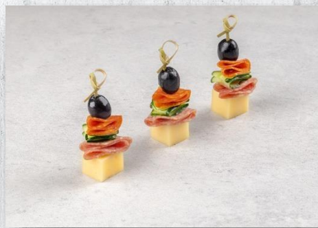
Канопе с двумя мясными деликатесами на сыре