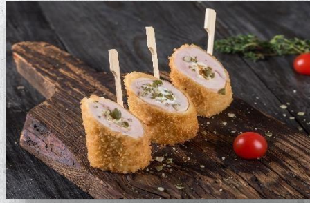
½ рулета из индейки с курагой в панировке 1 шт. / 60 гр. 205 руб.