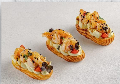
Эклер с креветкой, черри и крем соусом «Том Ям»