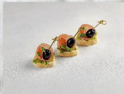
Канопе с саями милано и маслиной