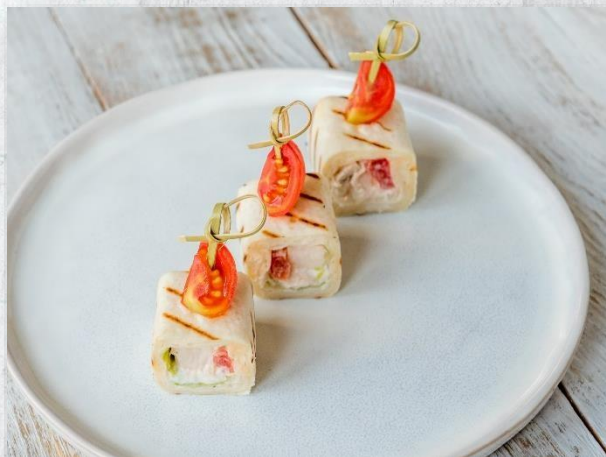
Ролл «Цезарь» с куриным филе и фирменным соусом