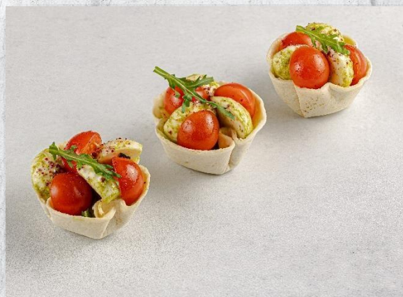
Корзинка «Швец» из мексиканской лепешки с салатом «Капрезе» 1 шт. / 40 гр. 170 руб.