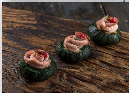
Профитроль из зелёного заварного теста с карпаччо из утиного филе