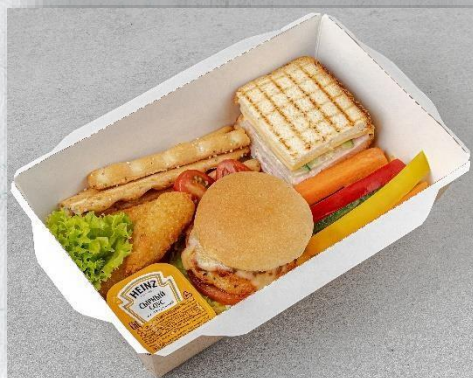
Бокс детский «Стюарт Литл»