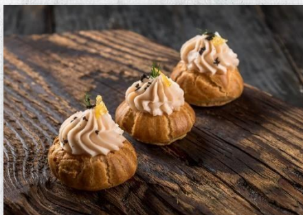
Профитроль из заварного теста с муссом из сёмги