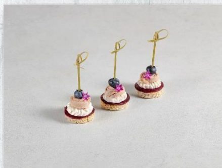
Канопе с утиным филе Су-Вид, свекольным карпаччо и голубикой