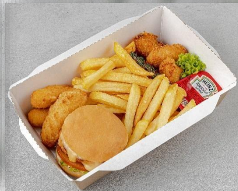
Бокс детский «Хот Вилс»