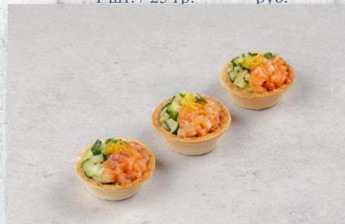
Тарталетка с тар-таром из семги и свежим огурчиком