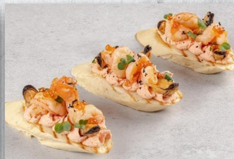
Брускетта с морепродуктами на подушке из крабового риета 1 шт. / 60 гр. 210 руб.