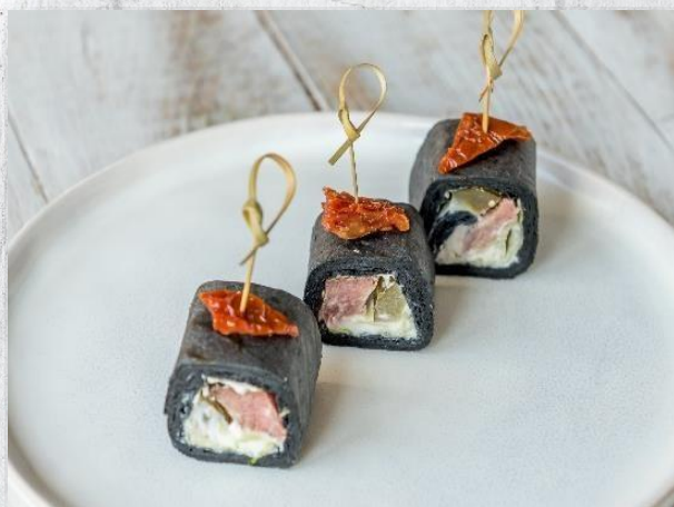
Ролл с ростбифом, корнишоном и вяленым томатом