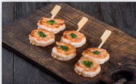
Королевские креветки гриль с брокколи 1 шт. / 35 гр. 265 руб.