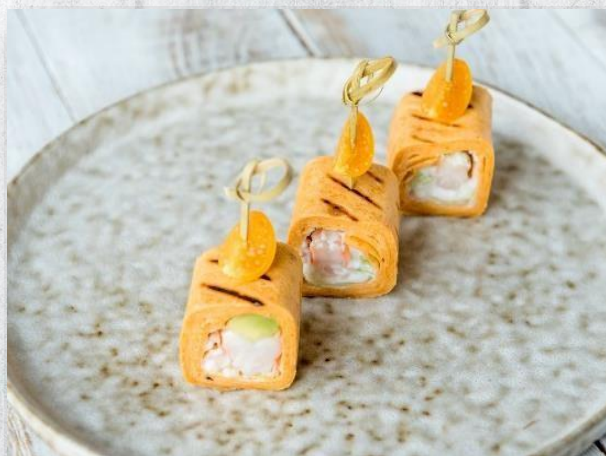
Ролл из лепешки с креветками, огурчиком и соусом «Том Ям»