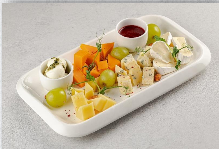
Ассорти из европейских сыров

(Пармезан, гауда блю, камамбер, моцарелла мини)