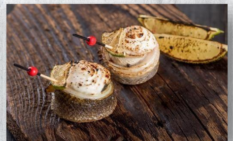
½ Брюшки Сибаса с сырным кремом и лимоном 1 шт. / 50 гр. 420 руб.