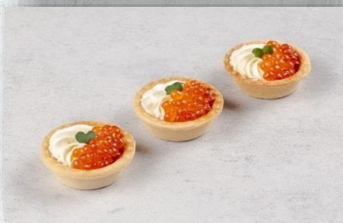
Тарталетка с сырным муссом и красной икрой