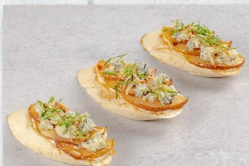
Брускетта с медовой грушей, миндалём и сыром блю 1 шт. / 50 гр. 170 руб.