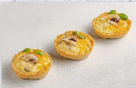
Киш с курицей и грибами