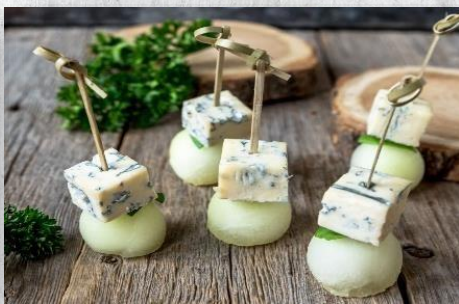
Канapé с сыром «Блю» на фруктовой подушке 1 шт. / 25 гр. 155 руб.