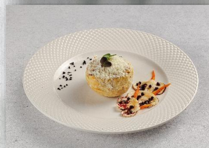
Фрикассе по-деревенски с куриным филе, грибами и кус-кусом в булочке