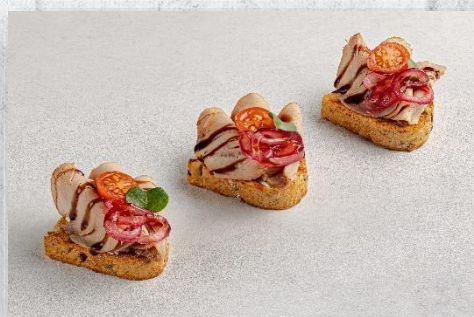
Брускетта с утиным филе ягодным соусом и луковым мармеладом 1 шт. / 40 гр. 215 руб.