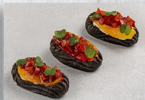
Эклер с печёным перцем, тар-тар из томата и соусом «крем-чиз»