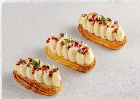
Эклер с классическим заварным кремом