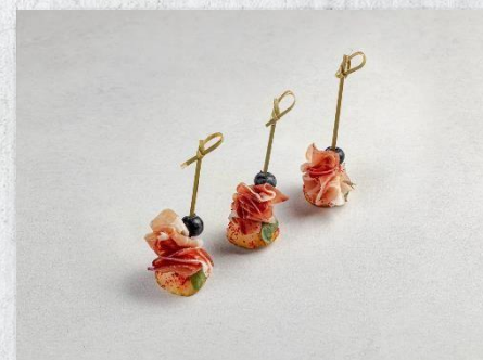
Канопе с хамоном, грушей и пудрой из клюквы