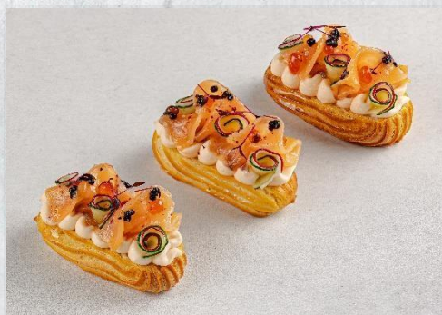
Эклер с сёмгой, икрой, огурчиком и соусом «крем-песто»