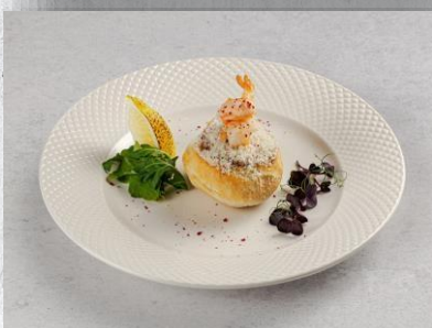
Ризотто по-Королевски с креветкой и рисом в белой булочке