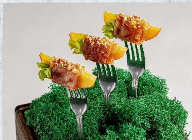
Жареный бекон с фруктом и присыпкой из фисташки на вилке