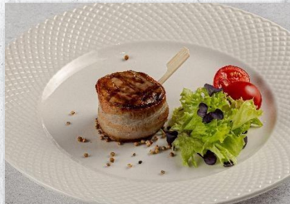
Свиной медальон из вырезки в беконе 1 шт. / 50 гр. 300 руб.