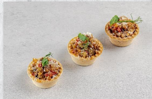
Тарталетка «А-ля аджап» с овощами гриль