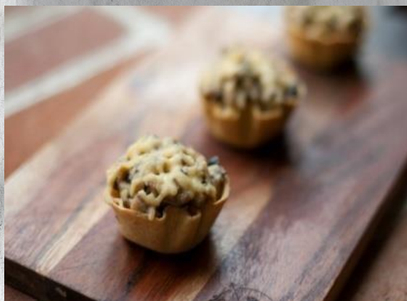
Корзинка «Швец» из мексиканской лепешки «Грибное лукошко» с жульеном 1 шт. / 45 гр. 145 руб.