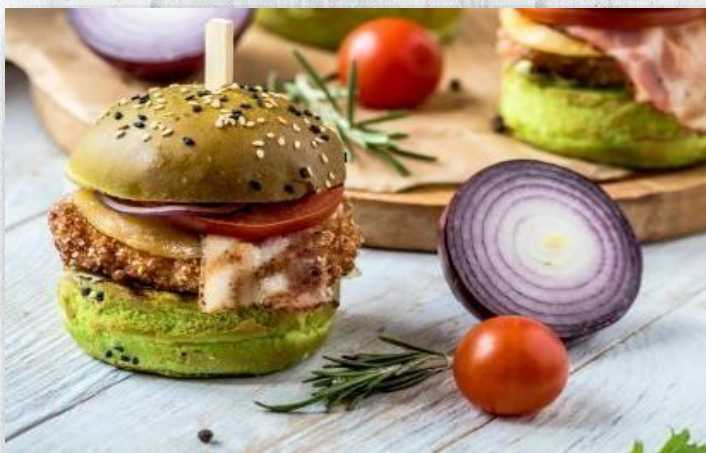
Зелёный бургер с куриной грудкой в панировке и беконом (диаметр 6 см)