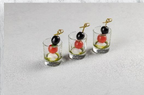
Канapé «Капрезе» с сыром моцарелла и томатом черри 1 шт. / 25 гр. 155 руб.