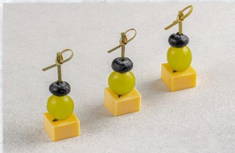
Полутвёрдый сыр с виноградом, голубикой и розмарином 1 шт. / 25 гр. 100 руб.