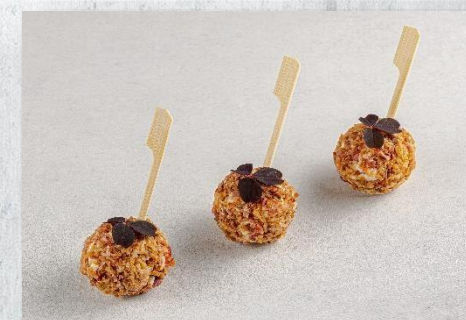
Сырный изыск «Чизболл» с жареным беконом и луком фри 1 шт. / 30 гр. 115 руб.