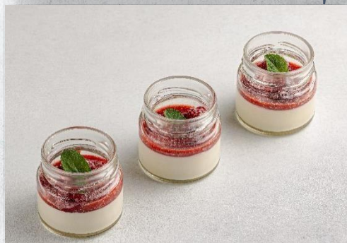
Сливочный десерт «Панна Котта»