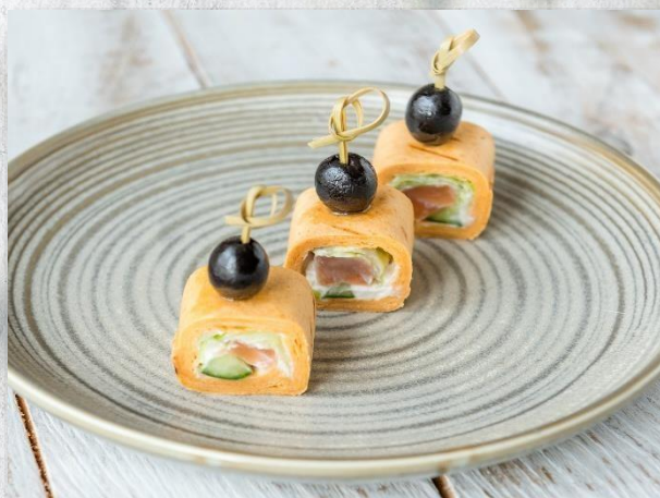
Ролл с сёмгой, огурцом и сливочным муссом