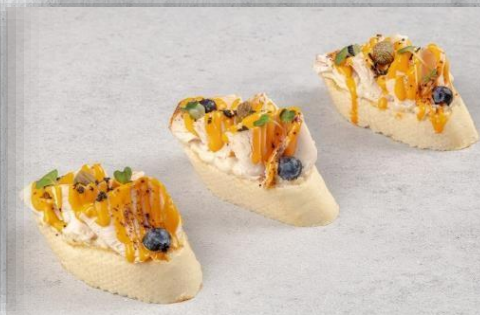
Брускетта с куриным филе «Вителло тоннато» с соусом цезарь 1 шт. / 35 гр. 145 руб.