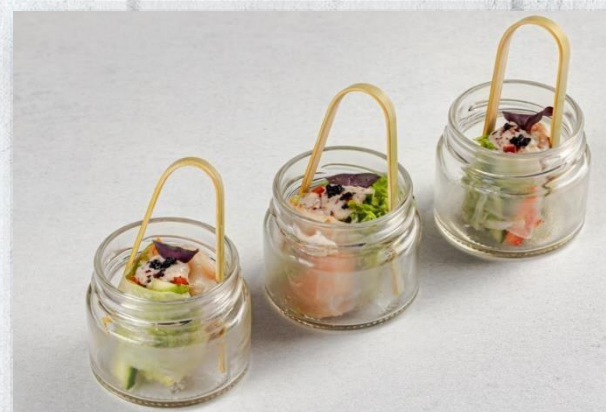
Ролл с креветкой, свежими овощами и ореховым соусом