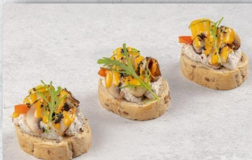
Брускетта с овощами гриль и грибным муссом 1 шт. / 35 гр. 130 руб.