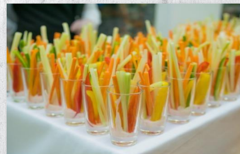
Салат «Витаминный шот» с соломкой из овощей и соусом