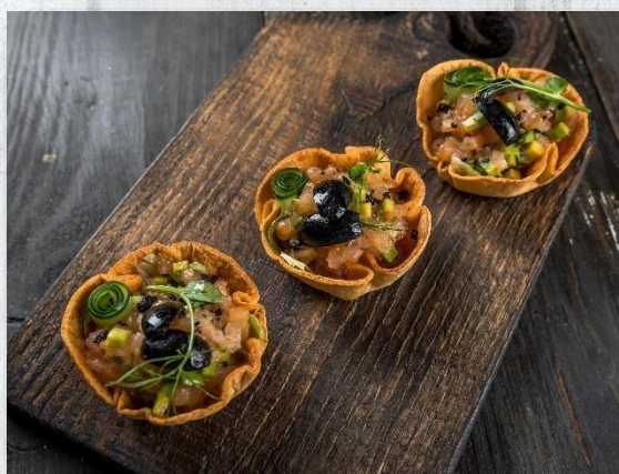
Корзинка «Швец» из мексиканской лепёшки с салатом из сёмги слабого посола, микса из зелени и огурчика 1 шт. / 45 гр. 230 руб.