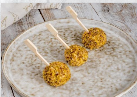
Сырный изыск из сыра «блю», микса орехов и винограда 1 шт. / 30 гр. 115 руб.