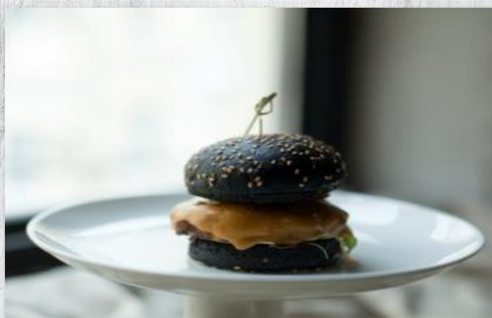
Чёрный бургер с 100%-ой говяжьей котлетой, солёным огурчиком и сыром Чеддер (диаметр 6 см)