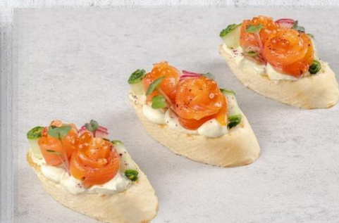
Брускетта с сёмгой, огурчиком, редисом и красной икрой 1 шт. / 40 гр. 215 руб.