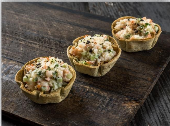
Корзинка «Швец» из мексиканской лепешки с креветкой и фирменным соусом 1 шт. / 45 гр. 190 руб.