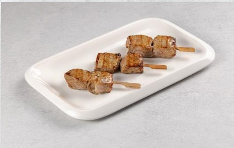
Шашлычок из свинины 1 шт. / 50 гр. 290 руб.