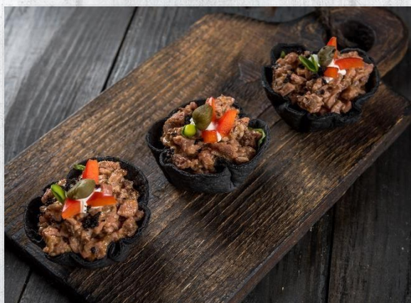
Корзинка «Швец» из чёрной мексиканской лепёшки с говядиной 1 шт. / 45 гр. 215 руб.