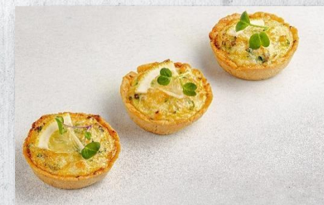
Киш с сёмгой и шпинатом