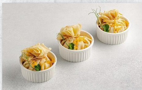
Блинчик-мешочек с Жюльеном из курицы