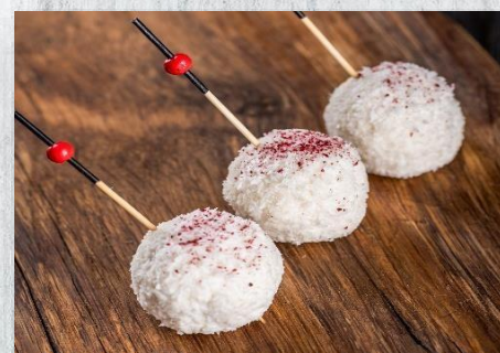
Сырный изыск из сыра «камамбер», кокосовой стружки и физалиса 1 шт. / 30 гр. 115 руб.