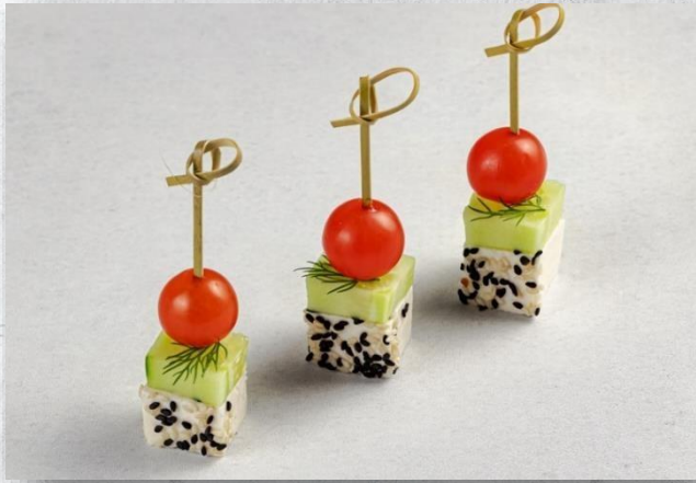
Канapé с томатом и сыром тофу 1 шт. / 20 гр. 130 руб.