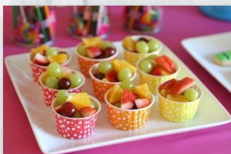
Фруктовый салат с заправкой