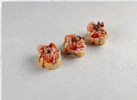
Брускетта с ветчиной и черри