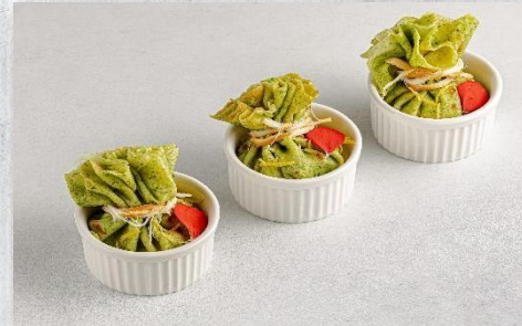
Блинчик-мешочек с жареной сёмгой