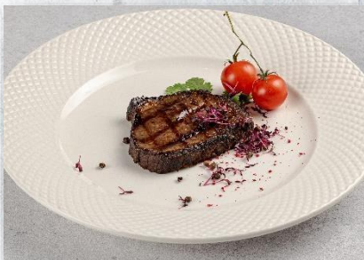
Медальон из говядины 1 шт. / 50 гр. 420 руб.