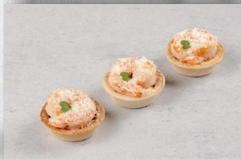
Тарталетка с креветкой гриль и соусом «крем-песто»