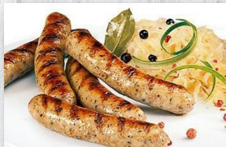
Немецкие свиноговяжьи колбаски 1 шт. / 25 гр. 120 руб.