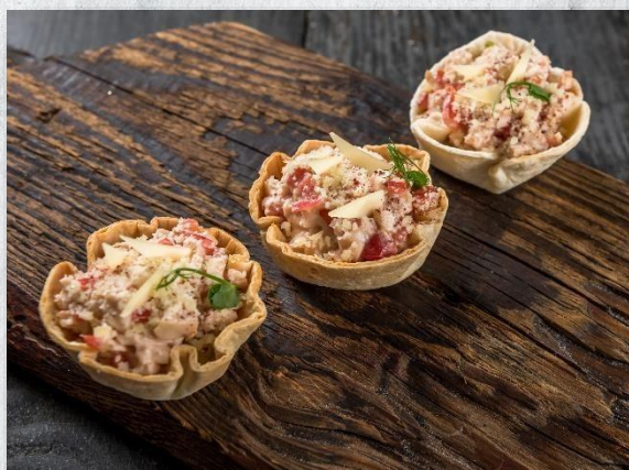
Корзинка «Швец» из мексиканской лепёшки с салатом «Цезарь» из куриного филе 1 шт. / 45 гр. 145 руб.