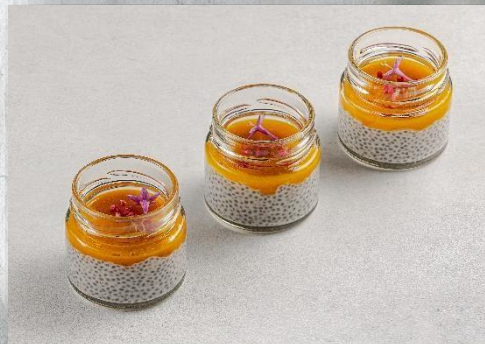
Нежный Десерт «Чиа да манго»