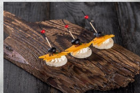
Сырный веер из красного чеддара с муссом и голубикой 1 шт. / 15 гр. 95 руб.