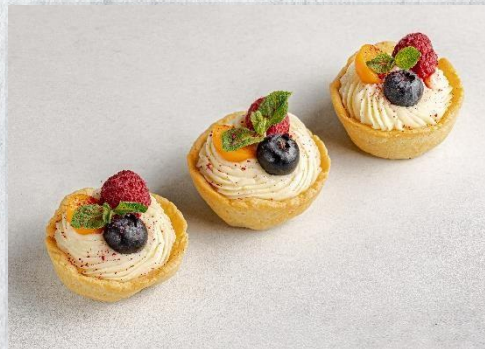
Тарт с ягодами