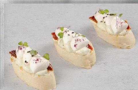
Брускетта с сыром моцарелла, вяленым томатом и соусом «крем песто» 1 шт. / 25 гр. 155 руб.