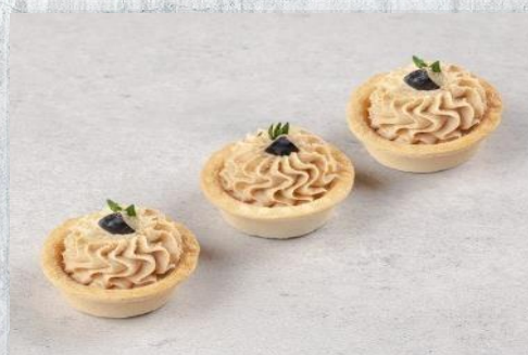
Тарталетка с муссом из утиной печени, клубничным конфитюром и печеньем