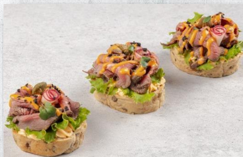
Брускетта с ростбифом, каперсом, редисом и перечным соусом 1 шт. / 40 гр. 190 руб.