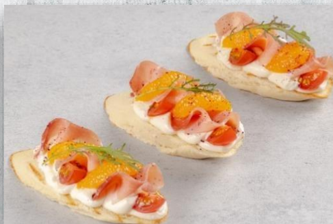
Брускетта с пармой и мандарином на подушке из сырного мусса Бри 1 шт. / 60 гр. 230 руб.