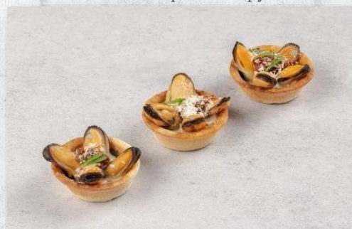
Тарталетка с мидиями, вяленным томатом и ореховым соусом