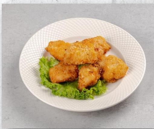
Домашние куриные наггетсы из куриной грудки