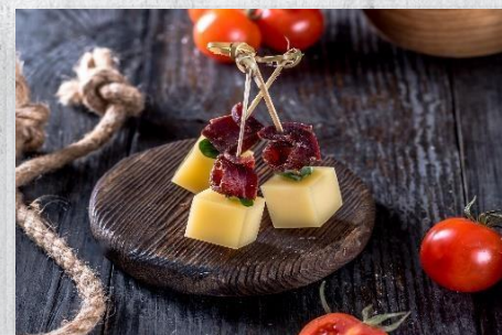
Пармезан с коппой и микрозеленью 1 шт. / 15 гр. 155 руб.