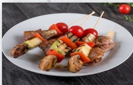
Овощи гриль с соусом бальзамик на шпажке