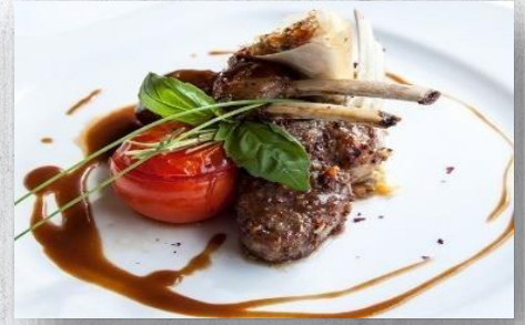
Каре ягнёнка (1шт) 1 шт. / 40 гр. 540 руб.