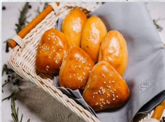
Пирожок с капустой