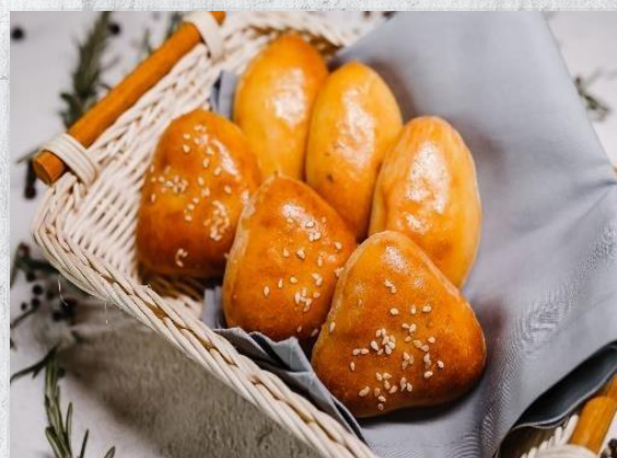
Пирожок с мясом (курица)