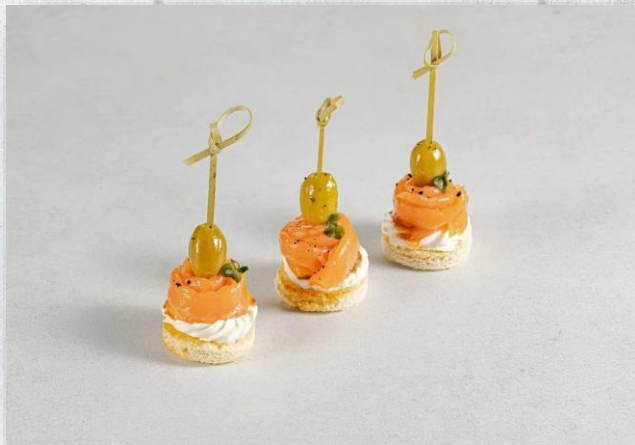
Канapé с семгой и оливкой 1 шт. / 20 гр. 155 руб.