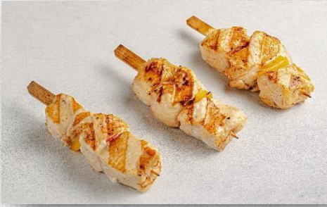
Шашлычок из куриного филе с болгарским перчиком 1 шт. / 50 гр. 190 руб.