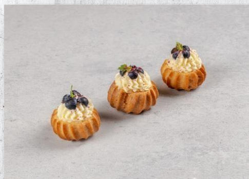
Профитроль с кремом и ягодой