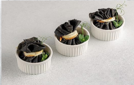
Блинчик-мешочек с фаршем из мяса