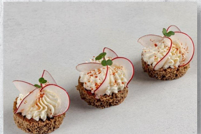
Канapé с редисом и кремом из тофу 1 шт. / 20 гр. 140 руб.