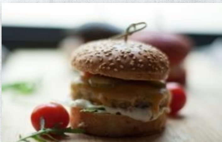
Бургер с куриной котлетой, свежими овощами и соусом «Цезарь» (диаметр 6 см)