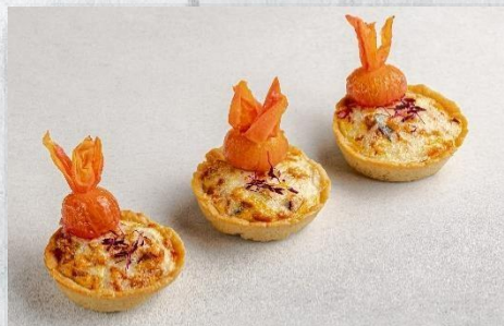
Киш с овощным соте