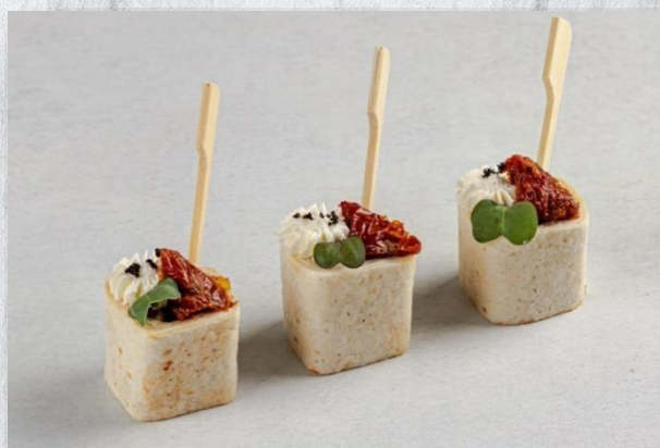
Ролл с мясным фаршем и овощной сальсой а-ля «Буритто»