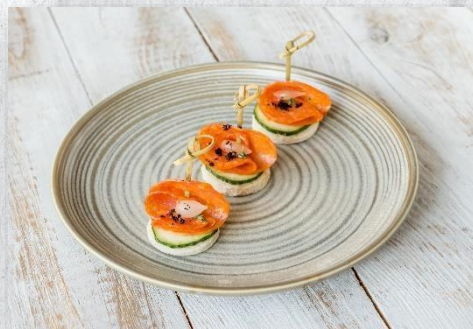
Канопе с пепперони, сыром и мини каперсом