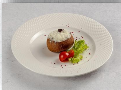
Бефстроганов по-Графски с говядиной и пюре в чёрной булочке