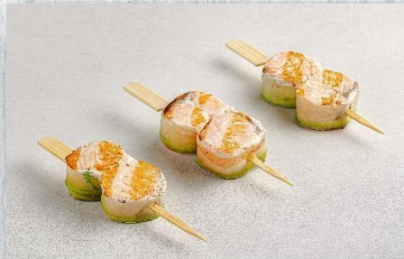
Шашлычок из сёмги с цуккини 1 шт. / 50 гр. 540 руб.