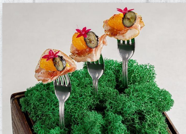
Коппа с мандарином и голубикой на вилке