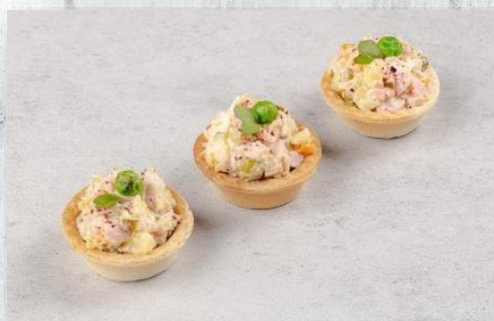
Тарталетка «А-ля Оливье» с копчёным куриным филе и «пудрой» из ягод