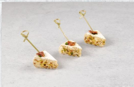
Сыр «Бри» с вяленным томатом и фисташкой 1 шт. / 18 гр. 145 руб.