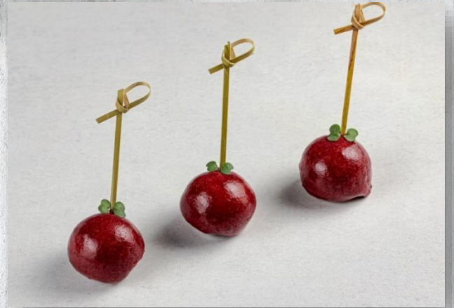
Конфета с утиной печенью и вишнёвым желе 1 шт. / 15 гр. 220 руб.