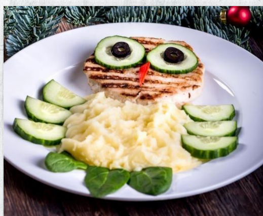
Котлета из куриных грудок и картофельное пюре «Совёнок»